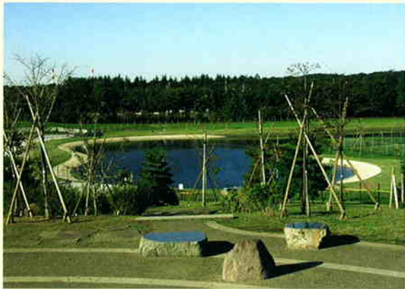
— 修景池 —