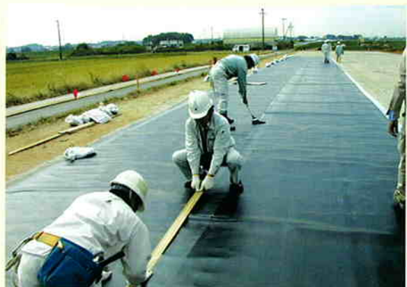
— オーバーキャップ —