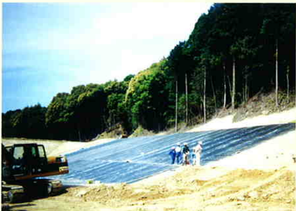
— 最終処分場 —