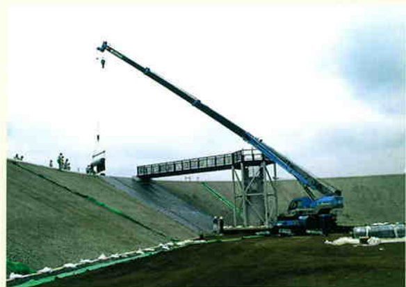
— ため池 —