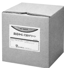
液体 20kg ダンボール箱入り