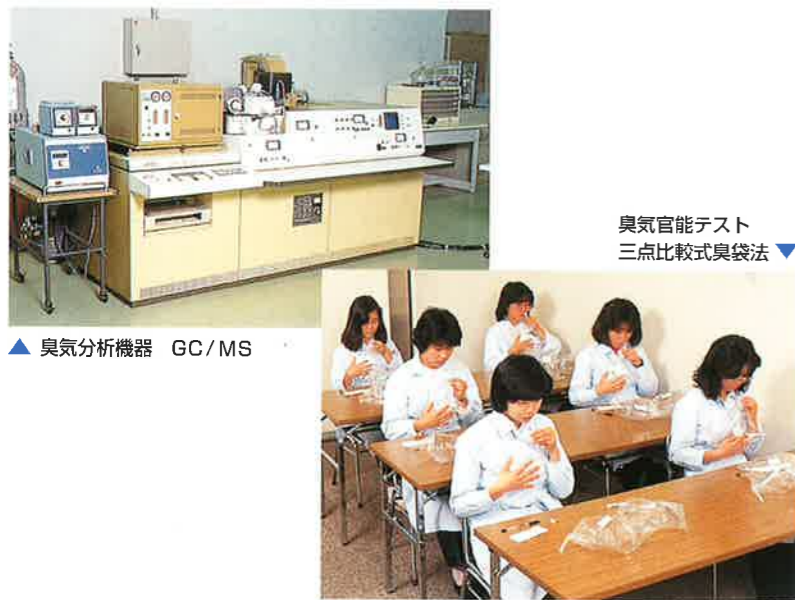
臭気官能テスト 三点比較式臭袋法

クリレイザーシリーズは、悪臭の発生源に直接作用させて効果的に悪臭成分を分解、または揮発化させて臭いを発生しないようにするものや、大気中に噴霧して臭気を中和したり、臭質を改善したりするものなど、多種多様な「臭い」に対応できるような豊富な種類をそろえています。