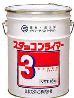
スタッコプライマー#3