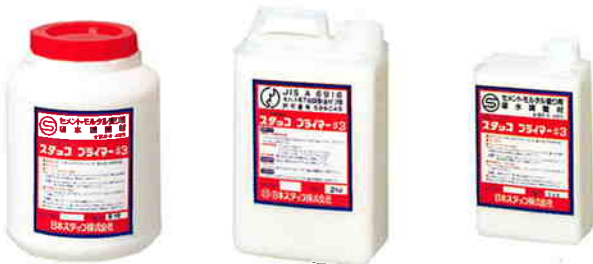
スタックプライマー#3