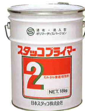
スタッコプライマー#2