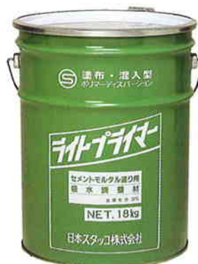
ライトプライマー