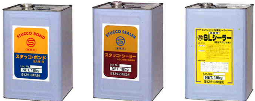
スタックボンド 注入用B