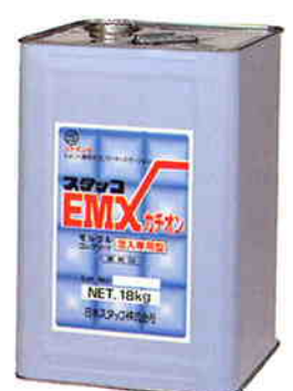
スタッコEMX カチオン