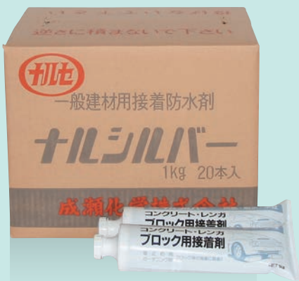
ナルシルバー (灰色)