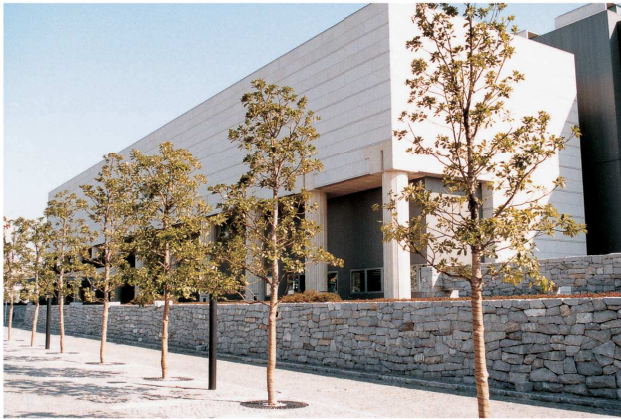
東京都立現代美術館