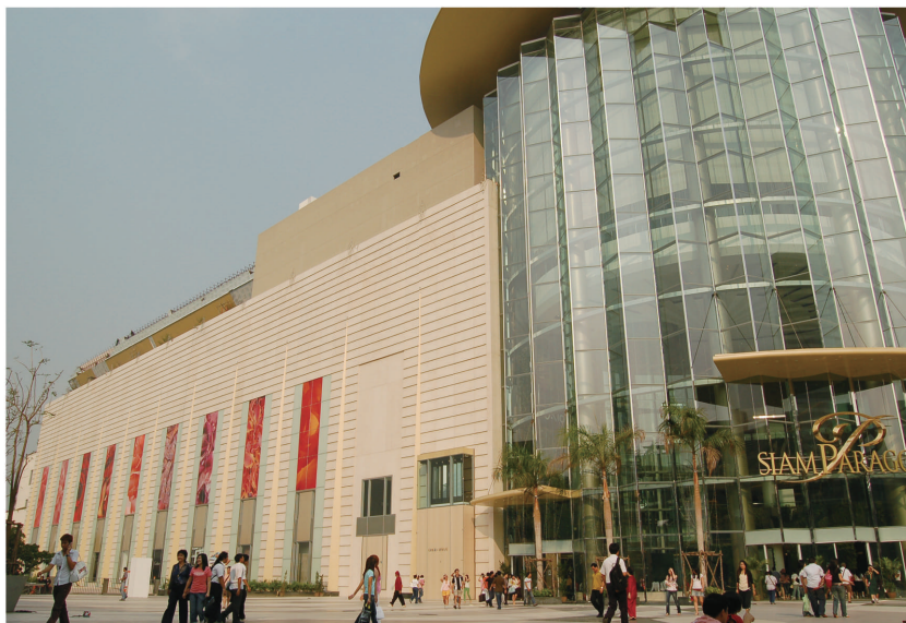
サイアムパラゴン