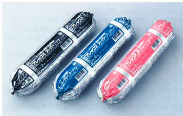
变成シリコーン・エポキシ樹脂系接着剤

内外装用タイルの張り付け施工用として開発された一液反応形の变成シリコーン・エポキシ樹脂系接着剤です。硬化後はゴム状の弾力性を持つため、下地変形や熱膨張などによる応力を緩和します。セメント目地不要工法としてもご使用頂けます。